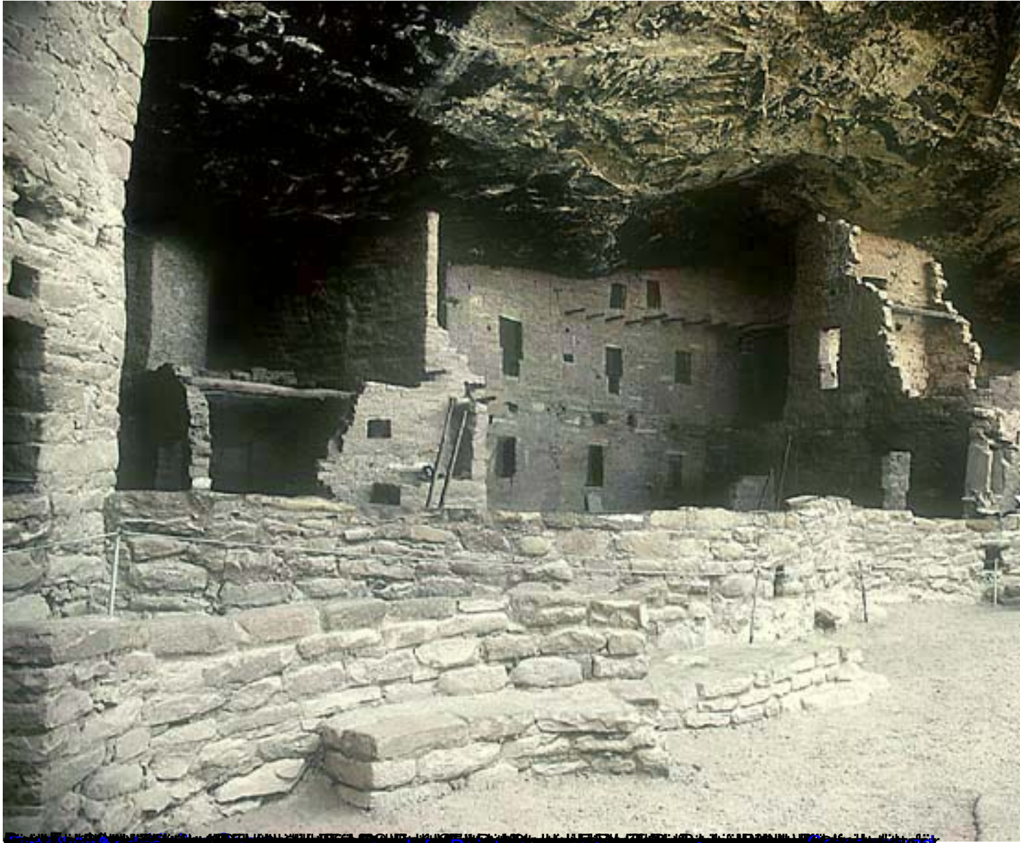
Bild von Wolfgang Oberdorfer dank sein bei Wolfgang für die Erstellung dieser Präsentation.