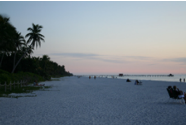
der Strand am Abend Naples - America's Best All-Around Beach

Naples ist ein bezauberndes Städtchen an Floridas südwestlicher Golfküste, fast schon mondän mit eleganter Atmosphäre. Breite, mit Läden, Kunstgalerien und Restaurants gesäumte Gehwege sowie zahlreiche palastartige Villen inmitten von tropischen Gartenanlagen laden den Besucher zum Bummeln und Schwelgen ein. Die schneeweißen Sandstrände, zahlreiche Golfplätze, vielfältige Wassersportmöglichkeiten und nicht zu vergessen die traumhaften Sonnenuntergänge haben die Gegend bekannt gemacht. In der Nebensaison von Mai bis Dezember lässt sich der Charme und das elegante Ambiente des Küstenstädtchen zudem zu deutlich niedrigeren Hotelpreisen genießen. Auch bei Familien und jungen Pärchen wird Naples immer beliebter. Das Image als Rentnerrefugium hat Naples mittlerweile auch durch seine lebendigen Cafészene in der Innenstadt und den vielen Angeboten für Outdoorfans komplett abgestreift und das Publikum ist nunmehr durch alle Altersstufen bunt gemischt.